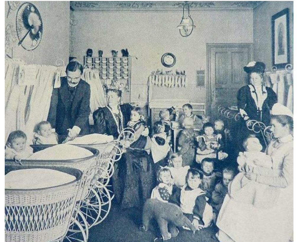
In einer Kita in Berlin im Jahr 1907